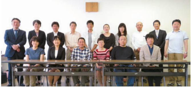
一年間よろしくお願ひします。