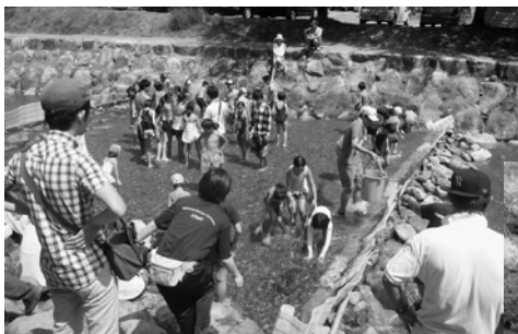
魚つかみ やったー！ 捕まえたー！